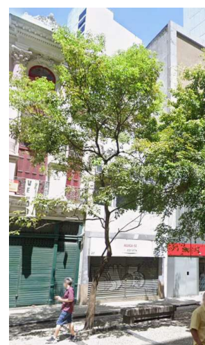
Rua da Candelária nº 60, Rua Uruguaiana nº 118 e Rua da Quitanda nº 23 IMAGEM: https://www.google.com/maps