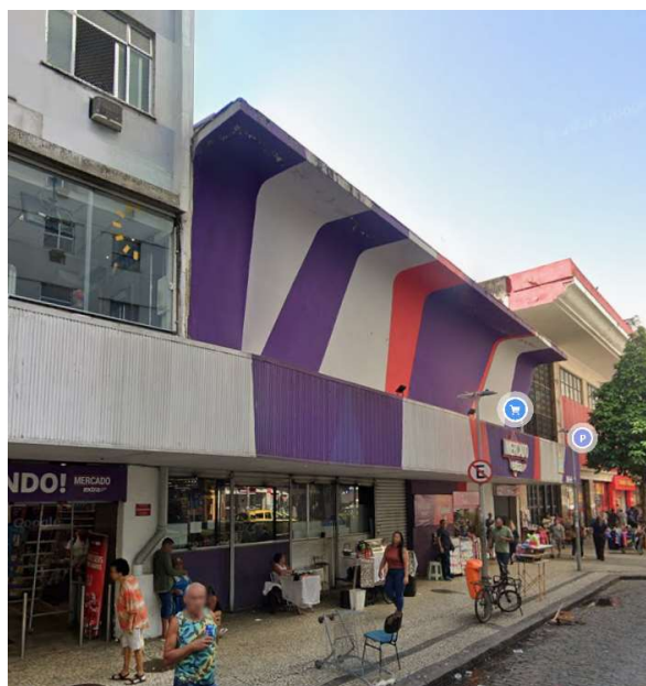
RUA RIACHUELO, Nº 214 IMAGEM: https://www.google.com/maps

Foi emitida uma nova licença com os favores da LC 229/2021, na Rua Riachuelo nº 214 (com numeração suplementar pela Rua do Rezende, 165), no bairro do Centro. Trata-se de construção de prédio, perfazendo um total de 500 unidades residenciais, 01 unidade comercial e 28.756,32 m 2 de ATC – Área Total Construída.