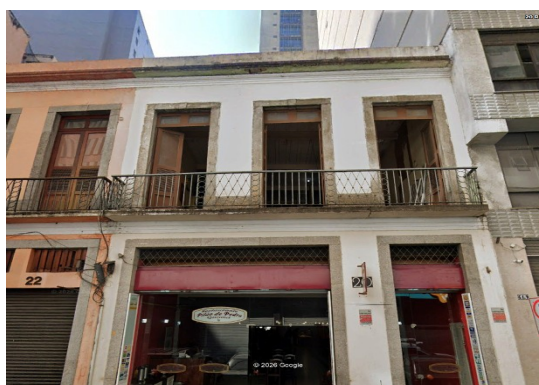
IDENTIFICA-SE O EDIFÍCIO NA COR BRANCA, QUE SERÁ PARCIALMENTE DEMOLIDO PARA CONSTRUÇÃO DE NOVA EDIFICAÇÃO.

Segue em destaque a imagem abaixo do empreendimento da descrição “Construção de prédio” na Rua Benedito nº20: