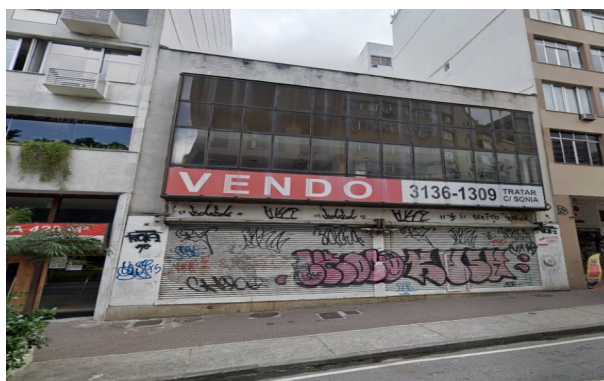
O EDIFÍCIO SITUADO NA RUA VISCONDE DE PIRAJÁ 640, EM IPANEMA, QUE SERÁ DEMOLIDO PARA CONSTRUÇÃO DE NOVA EDIFICAÇÃO.

Nas áreas receptoras foi licenciado novo empreendimento com os favores da Lei 229/21, na Rua Visconde de Pirajá 640, Ipanema.