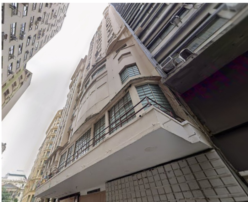
EDIFICAÇÃO LOCALIZADA NA RUA ALCINDO GUANABARA, 17 - CENTRO