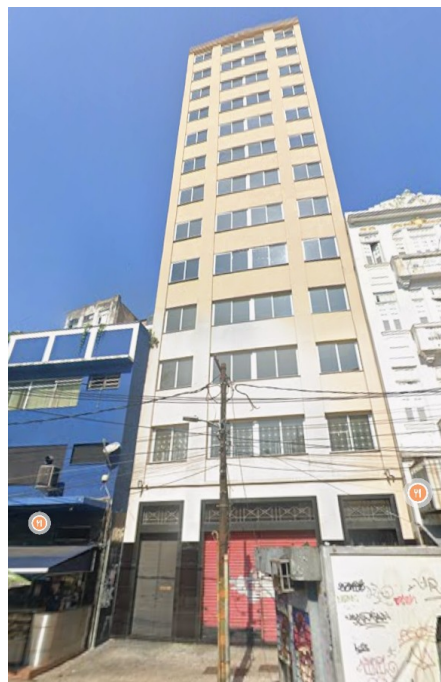
EDIFICAÇÕES LOCALIZADAS NA PRAÇA MAHATMA GANGHI Nº2 (APTOS 1122 E 1123) E NA PRAÇA MAUÁ Nº 13, NO BAIRRO CENTRO.